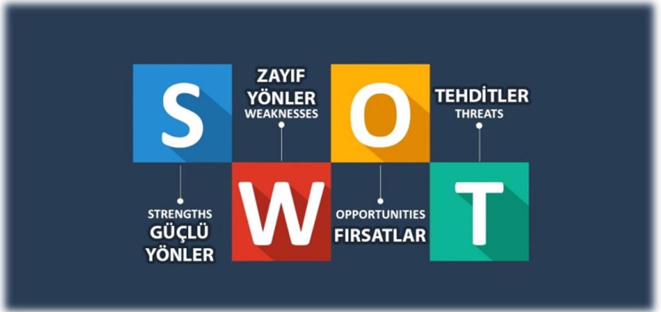
Şekil 2 GZFT Analizi

Kurumun güçlü ve zayıf yönleri donanım, malzeme, çalışan, iş yapma becerisi, kurumsal iletişim gibi çok çeşitli alanlarda kendisinden kaynaklı olan güçlülükleri ve zayıflıkları ifade etmektedir ve ayrımda temel olarak okul müdürü/müdürlüğü kapsamında bakılarak iç faktör ve dış faktör ayrımı yapılmıştır.